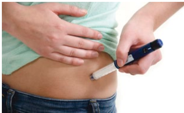
Une personne diabétique s'injecte de l'insuline dans le ventre pour réguler son taux de sucre dans le sang.