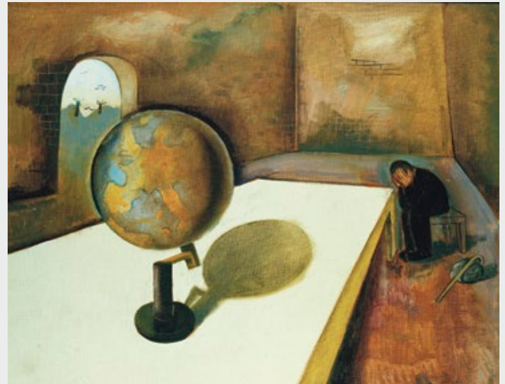
Felix Nussbaum, Der Flüchtling , 1939, Leihgabe Irmgard und Hubert Schlenke, Ochtrup © 2014, ProLitteris, Zurich

L'art permet de véhiculer des émotions positives aussi bien que négatives. Le Musée international de la Croix-Rouge et du Croissant-Rouge, en collaboration avec le Mamco, a choisi de faire de la souffrance le cœur de son exposition intitulée Trop humain. Artistes des XX e et XXI e siècles devant la souffrance qui est visible jusqu'au 4 janvier 2015. En plus de la dimension artistique de l'exposition, un cycle de sept visites-conférences est organisé par le Centre interfacultaire en sciences affectives (CISA) de l'Université de Genève afin d'appréhender la souffrance sous un angle scientifique. Du 30 septembre au