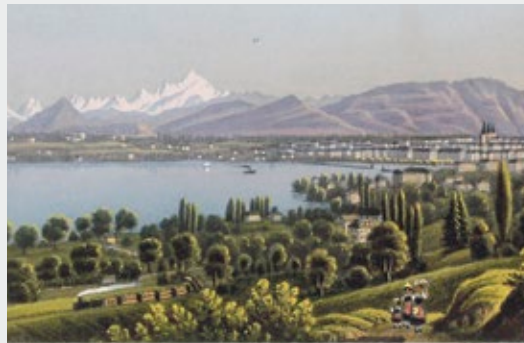
Genève et le Mont-Blanc, vue prise de Pregny entre 1852 et 1888

Le cycle de conférences commencera le 1 er octobre par «Genève, capitale extérieure de la France protestante (XVI e -XXI e s.)?», se poursuivra, la semaine suivante, par un examen des relations entre juifs et protestants de l'Europe réformée et se terminera, le 15 octobre, avec «Les protestants français ont-ils inventé la laïcité?»