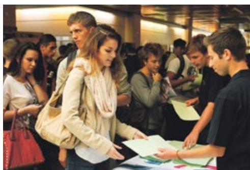
Journée d'accueil des étudiants.

Le conseil est composé de 15 sièges. Six sont réservés aux représentantes et représentants des associations étudiantes, sept aux étudiants, deux