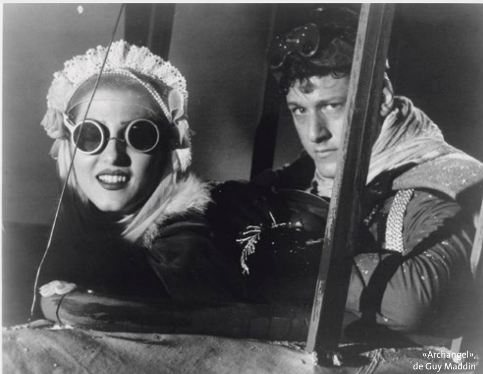
«Archangel», de Guy Maddin

Le cinéaste canadien Guy Maddin est un des grands réalisateurs contemporains. Son œuvre, d'une originalité et d'une force rares dans le cinéma actuel, se nourrit de sa passion pour le cinéma muet, dont il s'inspire librement pour construire des fictions surprenantes et hypnotiques. Le prochain cycle du ciné-club universitaire invite à découvrir l'œuvre de Guy Maddin, mais est également un parcours singulier au travers de l'histoire du cinéma avec la projection de quelques-uns des films favoris de Maddin, qui donnent une place essentielle au cinéma muet.