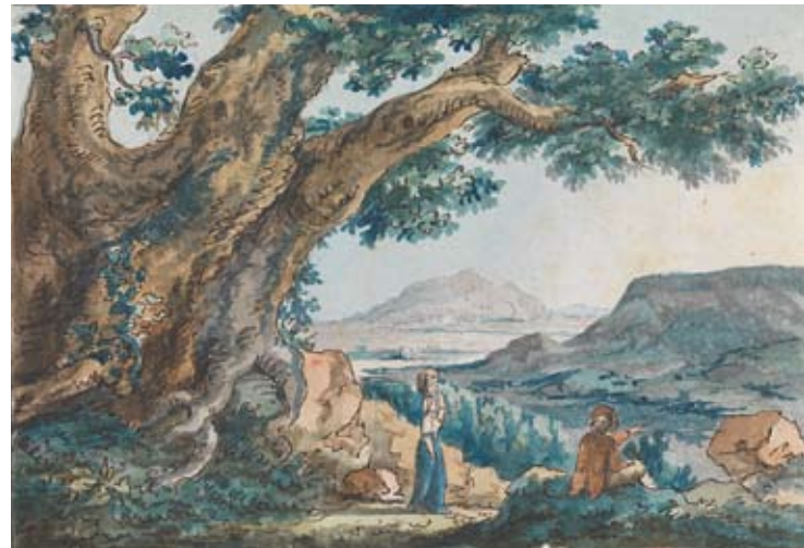
Johann Wolfgang von Goethe, Paysage , vers 1788, dessin à l'encre brune et aquarelle sur papier beige, Fondation Martin Bodmer