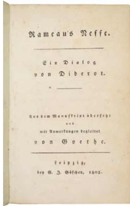
Johann Wolfgang von Goethe, Rameaus Neffe , Ein Dialog von Diderot , Leipzig, 1805, première édition de la traduction de Goethe, Fondation Martin Bodmer

Le retentissement international de cette exposition sera aussi assuré grâce à la redécouverte d'une lettre «religieuse» considérée comme perdue de Goethe (Bibliothèque cantonale et universitaire de Lausanne) et aux prêts exclusifs de la Klassik Stiftung Weimar.