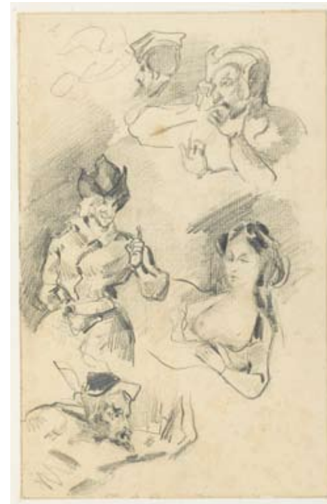
Eugène Delacroix, Etudes de bustes pour le Faust de Goethe traduit par Stapfer , vers 1828, crayon sur papier, Fondation Martin Bodmer