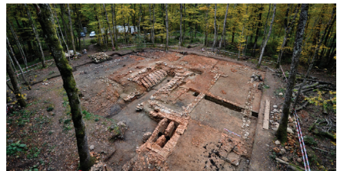
Bois de Chancy