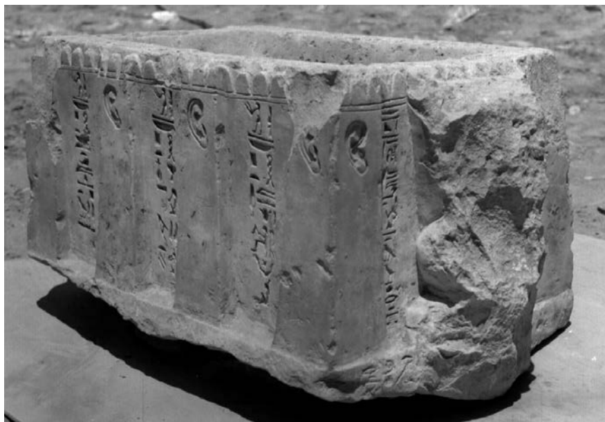
Fig. 4 : bassin à bastions crénelés de Mit-Rahineh (cliché Jacquet 1326, de 1956 / Chicago House (Oriental Institute), Louqsor).

le lieu de ces invocations comme « le grand bastion, c'est la place d'écouter les suppliques » ( tsm.t wr.t s.t pw n.t sdm snmh ) 50 . Enfin, à peu de distance encore fut découverte une petite chapelle en calcaire datant de l'époque de Séthi I er et qui renfermait notamment, à la gauche d'une statue du dieu Ptah, celle d'une déesse anthropomorphe coiffée d'une singulière tour crénelée et justement dénommée tsm.t wr.t , « le grand bastion », véritable personification divine et aboutissement ultime de cette muraille secourable (voir fig. 5) 51 .