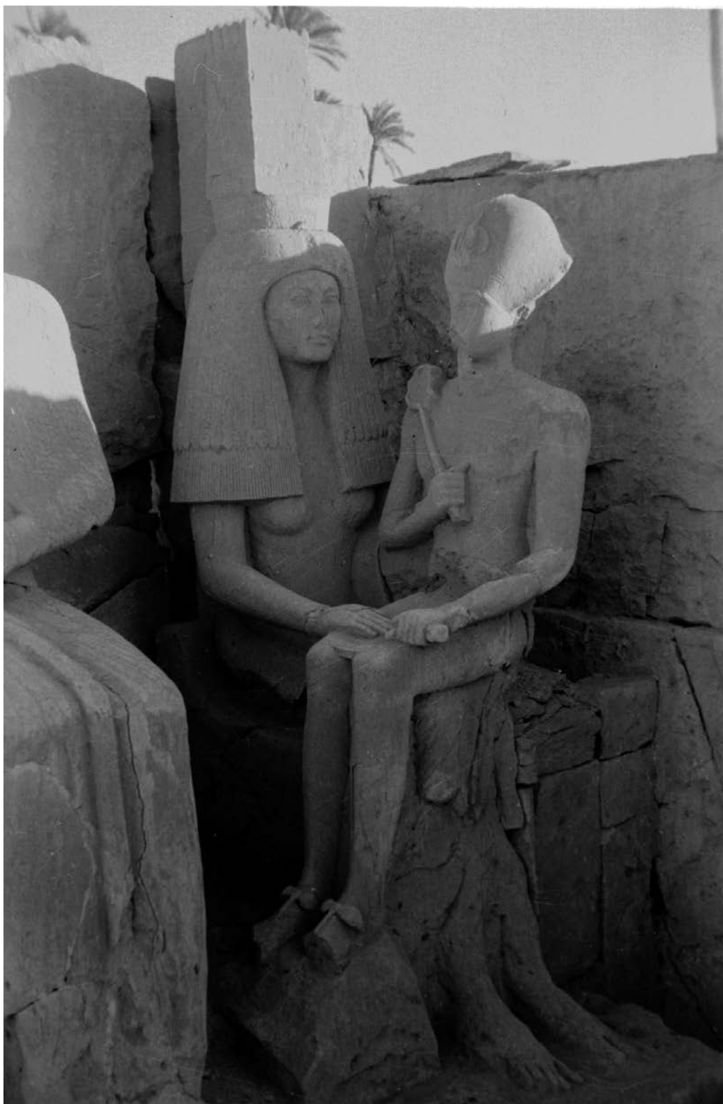
Fig. 5 : déesse « Grand-bastion » de la chapelle de Mit-Rahineh (cliché Jacquet 2877, 17 décembre 1960 / Chicago House (Oriental Institute), Louqsor).