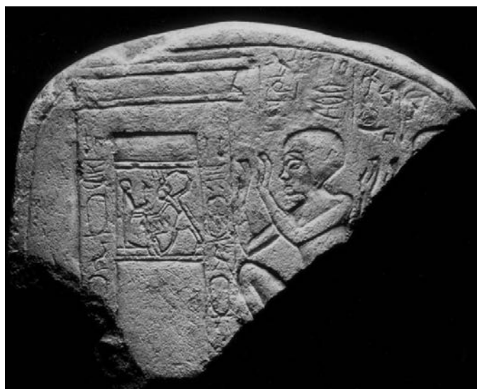
Fig. 2 : stèle commerce d'art (Catalogue de vente Christie's London, Antiquities. Wednesday 25 April 2007 , p. 58, n° 78).

On peut ajouter à ces exemples une douzième stèle, fragmentaire, passée récemment dans le commerce d'art (voir fig. 2) 38 . Une copie du texte de cette stèle est donnée par W.F.I. Petrie dans sa publication 39 , et permet d'établir qu'elle faisait donc initialement partie du lot découvert par ce fouilleur. On y voit un soldat suivi de son épouse agenouillés et adorant la même image du roi massacrant l'ennemi devant Ptah dans l'espace d'une porte.