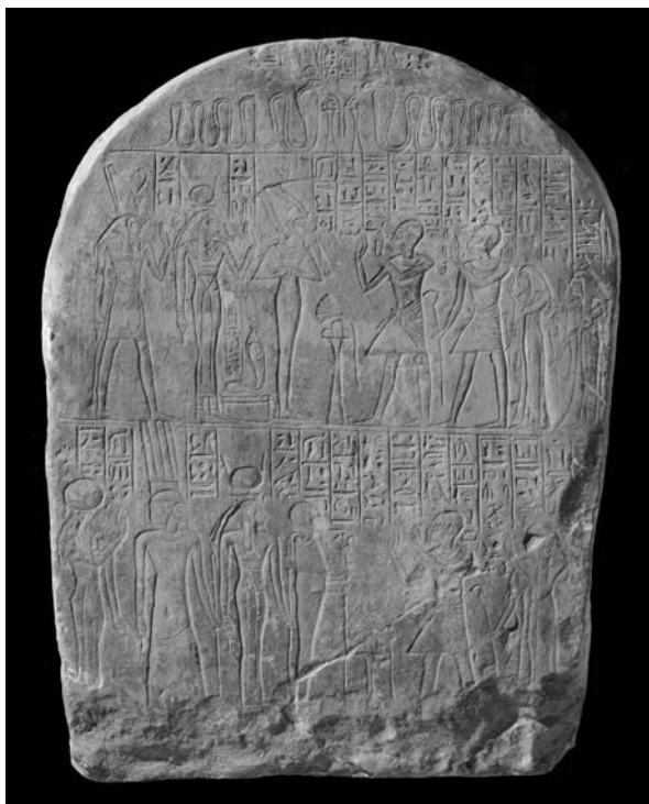
Fig. 6 : stèle Naples, Musée archéologique national n° 1020.

L'« Amon-de-l'embrasure » honoré par Nebbouneb à Karnak trouve un parallèle intéressant dans une « Isis-de-l'embrasure » célébrée par un certain Paoukhed sur une stèle de Naples datée de la 19 e ou 20 e dynastie (voir fig. 6) 84 . La stèle n'a pas de provenance avérée mais les données internes laissent peu de doute sur son origine abydnienne 85 . Dans le cintre de la stèle figurent deux cobras coiffés d'une couronne complexe et nommés « Renenoutet-de-la-ouâbet » ( rnw.t n t' w c b.t ) (à gauche) et « Ouret-hékaou-de-Ou-peger (?) » (à droite) 86 .