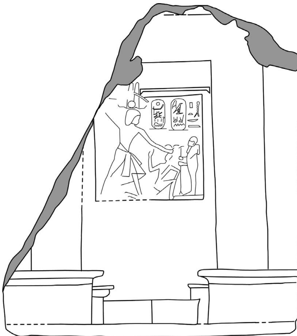
Fig. 3 : stèle New York, Metropolitan Museum of Art n° 64.285 (facsimilé J. Cayzac).

de quelques fidèles auprès de l'image d'embrasure ; mais, pour autant, l'accès à cette image nécessitait de passer les deux battants fermés de l'avant-porte, qui devaient très certainement se refermer derrière le visiteur, procurant ainsi au fidèle introduit un certain sentiment d'intimité divine.