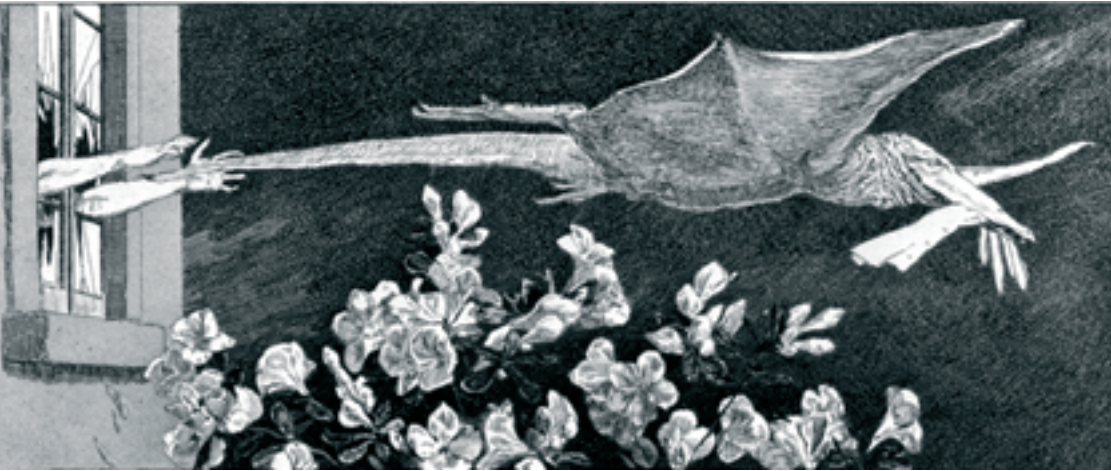
Illustration: Max Klinger, «Le Rapt», Paraphrase sur la découverte d'un gant (1881)

La configuration des valeurs dans la littérature et les arts du XIX e siècle