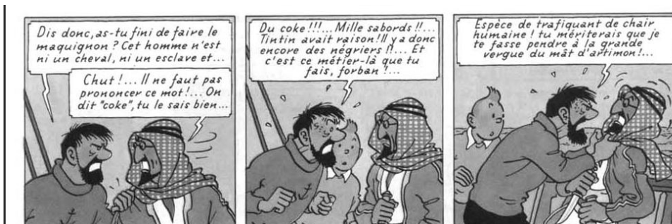
Hergé, Coke en stock , 1958. © Casterman.

Organisation et contacts : olivier.grenouilleau@free.fr; Michel.Porret@unige.ch