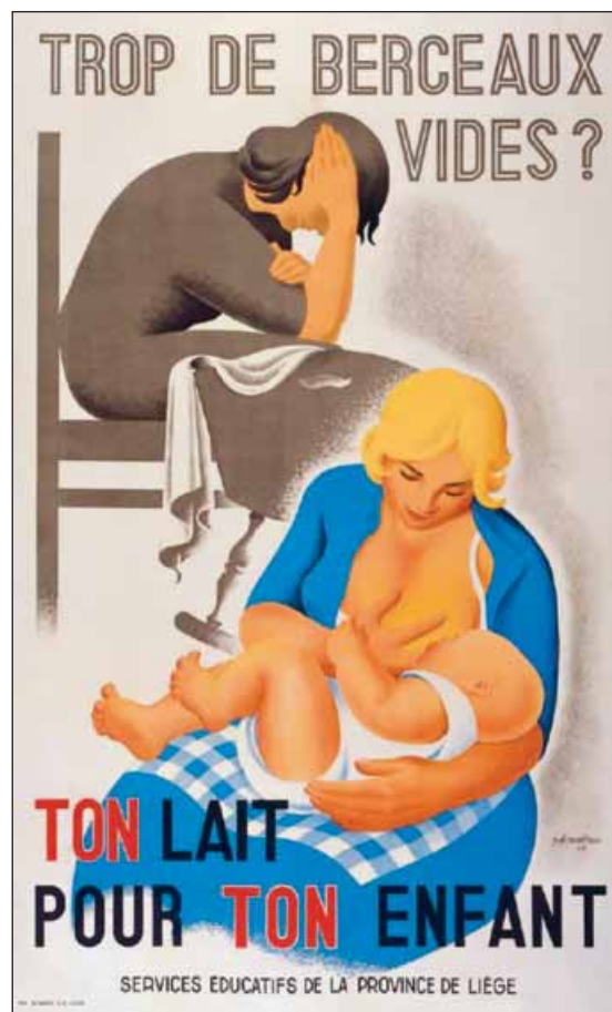
Po Mathieu, 1949, Wellcome Library, Londres.

Même le pape y va de ses conseils. Célébrant des baptêmes dans la chapelle Sixtine le 8 janvier, il remarque que «quelqu'un pleure parce qu'il a faim. Si c'est comme ça, vous les mamans, donnez le sein, sans crainte, en toute simplicité. Comme la Madone