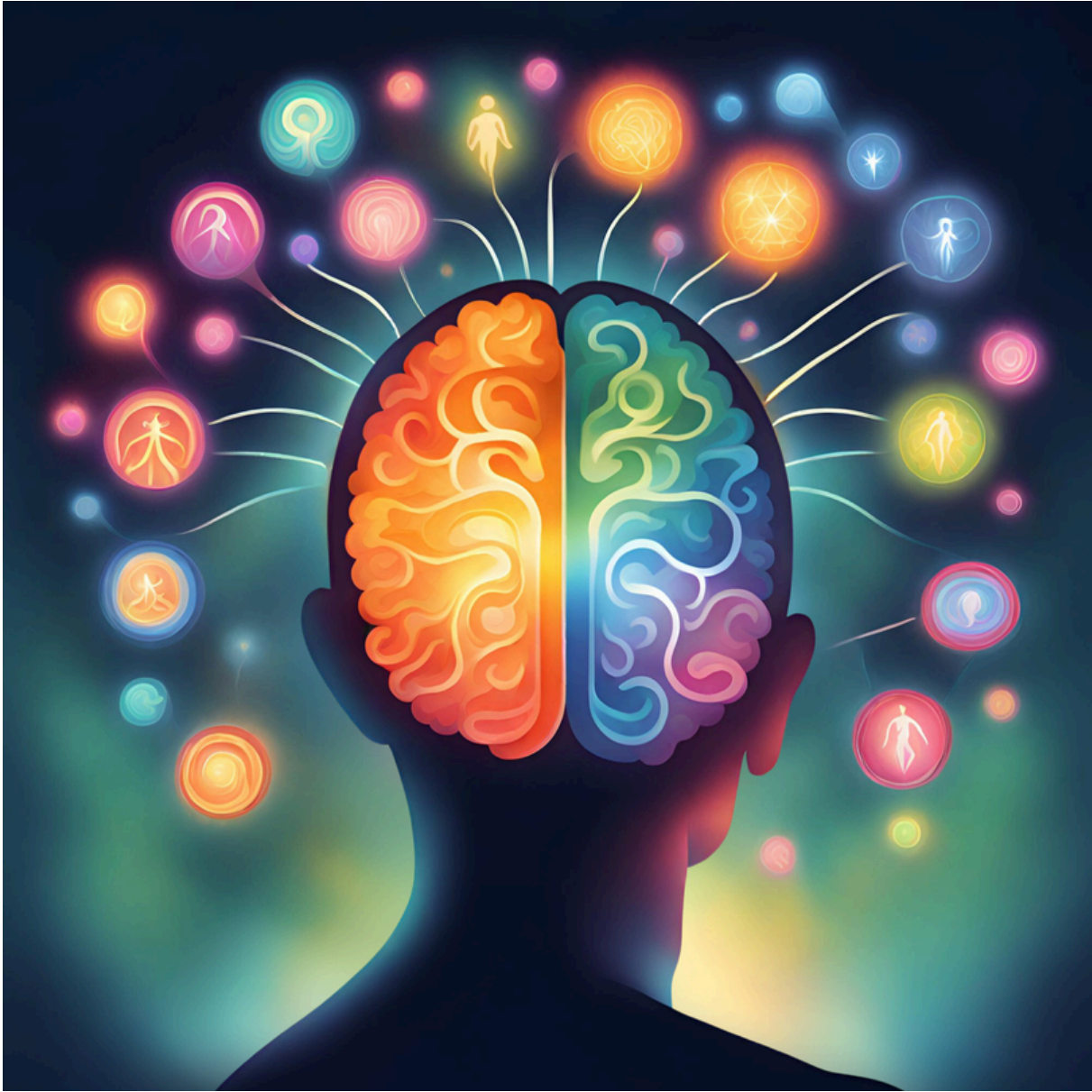
Portrait généré par une Intelligence artificielle : Média Magique Canva

SSE - Août 2024 Document produit à la suite de l'événement "Au-delà des apparences" organisé dans le cadre des Journées nationales d'action pour les droits des personnes handicapées Avenir Inclusif .