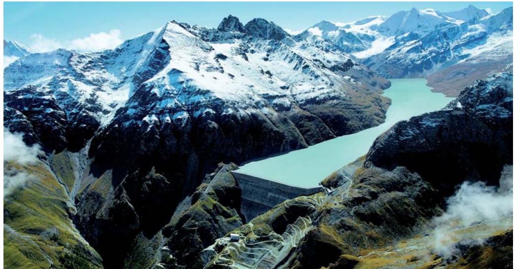
The Grande Dixence dam. The highest gravity dam in the world (285 m high), is located in the Val des Dix in Valais. Built between 1953 and 1961 on the site of a glacial lock, it has the capacity to produce - together with the dam of Cleuson - 2'000 Megawatt of energy.

dicine (MUSE), and a possibility for a bi-disciplinary Master. These Master programs present to students the opportunity to specialize in scientific domains at the crossroads of Earth and Environmental Sciences with Social Sciences on topics as varied as the water cycle, ecology, toxicology, climate (change), geo-energy, raw materials, earth and environmental management or geological risk assessment. The interdisciplinary approach, a wide choice of field trips with access to a vast natural laboratory, represented by the Jura or the Alps and Lake Geneva, the possibility of learning many state of the art techniques as well as the number of internal and external experts guarantee an excellent training under high quality leadership.